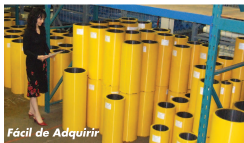
Fácil de Adquirir