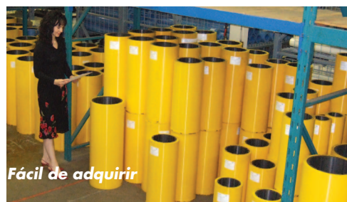
Fácil de adquirir

Gran Inventario disponible en stock. Fácil de instalar